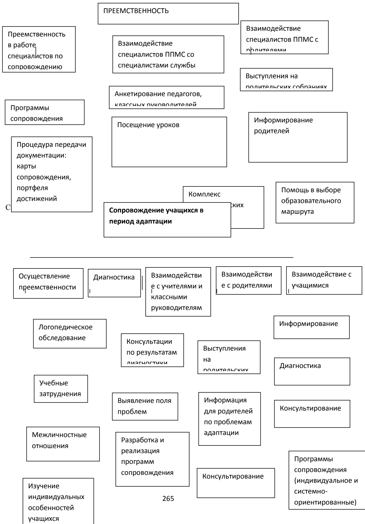
Схема 1 Осуществление преемственности